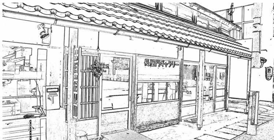
長屋門とは、江戸時代に多く建てられた形式で、細長い長屋の中央に扉を設けた門